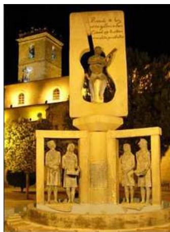
Ayuntamiento de Casasimarro

Cada usuario podrá suscribirse como máximo a 4 áreas de información.